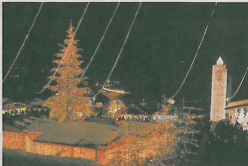
Ein zauberhaftes Bild bot gestern Abend der Blick vom Eingangsbereich der Triberger Wasserfälle.