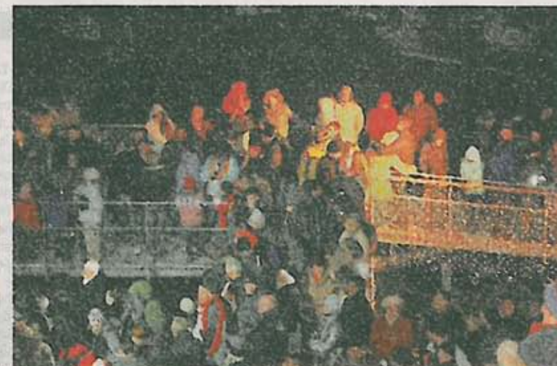
Romantische Stimmung. Pünktlich zum Auftakt am ersten Tag fielen viele dicke Schneeflocken vom Himmel.