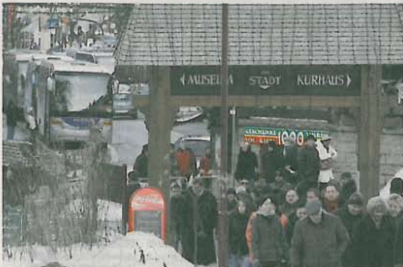
Großer Andrang gestern Mittag: Viele Besucher sind mit dem Bus nach Triberg gereist.