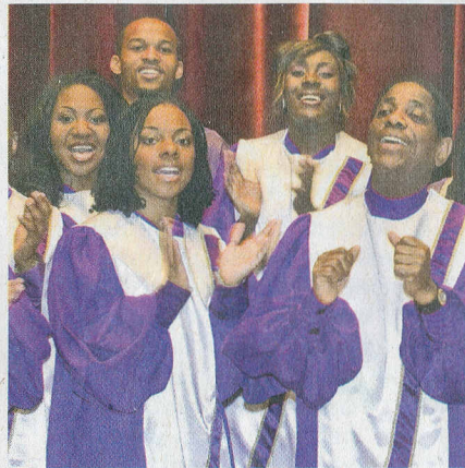
„The Golden Voices of Gospel“ gehören zu den großen Künstlern in Triberg.