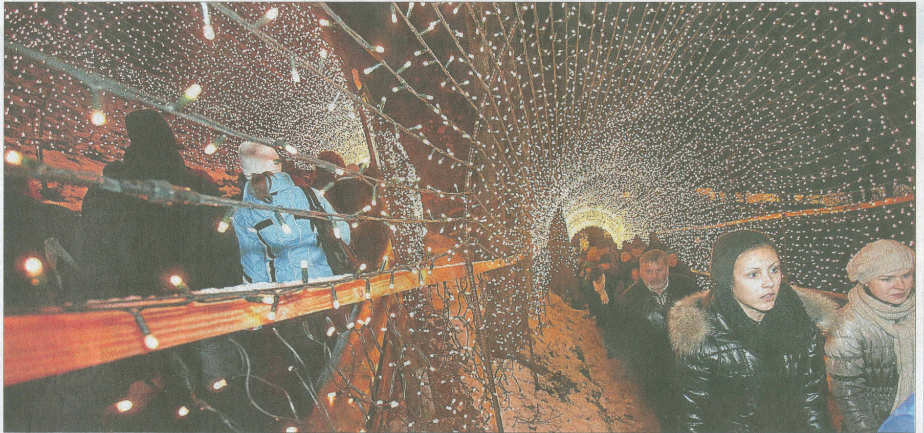
So viele Besucher wie noch nie zuvor kommen zum Auftakt des achten Triberger Weihnachtszaubers mit 800 000 Lichtern.